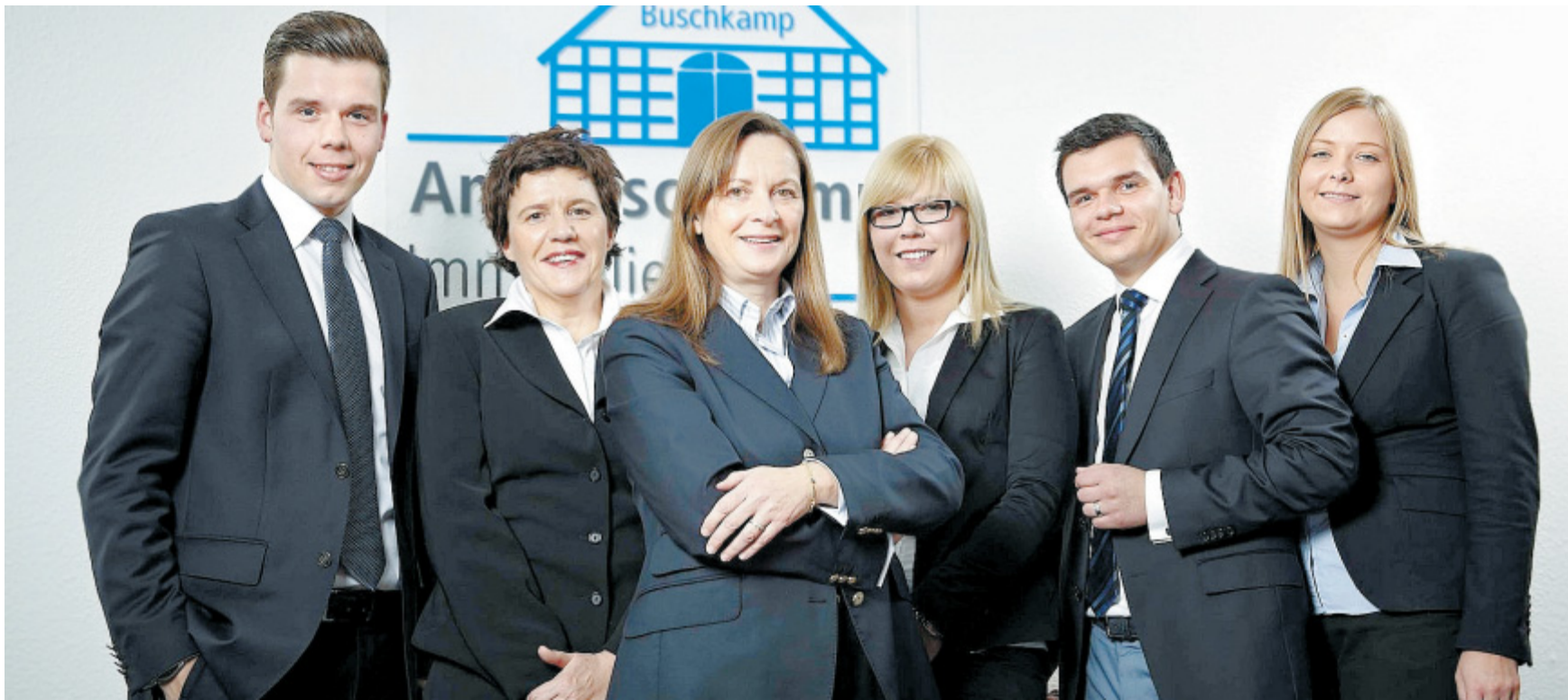
Partnerschaftliche Beratung: Für die versierten Mitarbeiter von Am Buschkamp Immobilien stehen die Wünsche der Kunden und eine gute, oft auch dauerhafte Kundenbeziehung an erster Stelle.