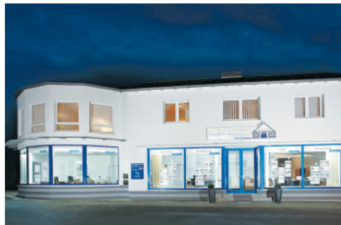
Anbau kam später: Am ersten Februar wurde das Bürogebäude an der Osningstraße 481 bezogen.